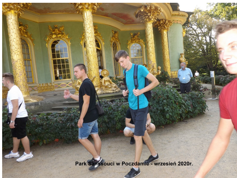
Chiński Dom w Parku Sanssouci -Poczdám