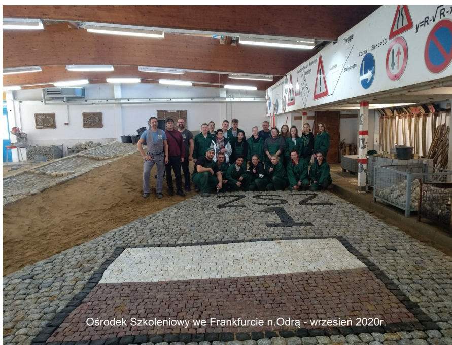
Ośrodek Szkoleniowy we Frankfurcie n.Odra - wrzesień 2020r.