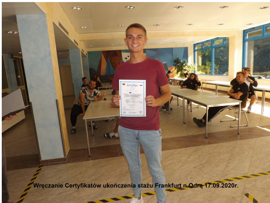
Wręczenie Certyfikatów ukończenia stażu Frankfurt n.Odrą 17.09.2020r.