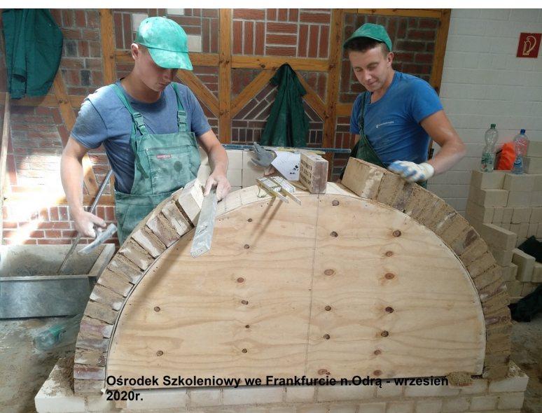
Ośrodek Szkoleniowy we Frankfurcie n.Odra - wrzesień 2020r.