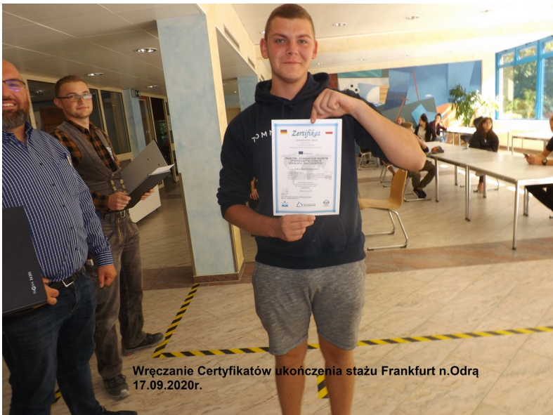
Wręczenie Certyfikatów ukończenia stażu Frankfurt n.Odrą 17.09.2020r.