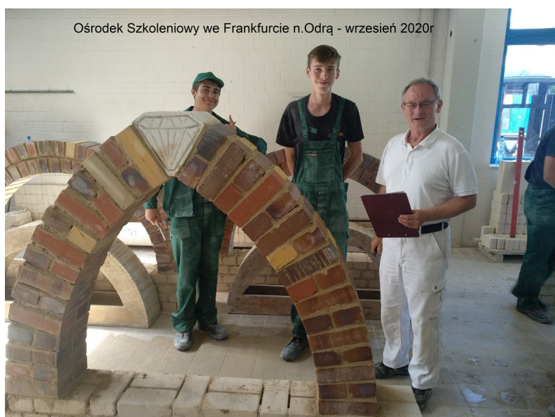
Ośrodek Szkoleniowy we Frankfurcie n.Odra - wrzesień 2020r