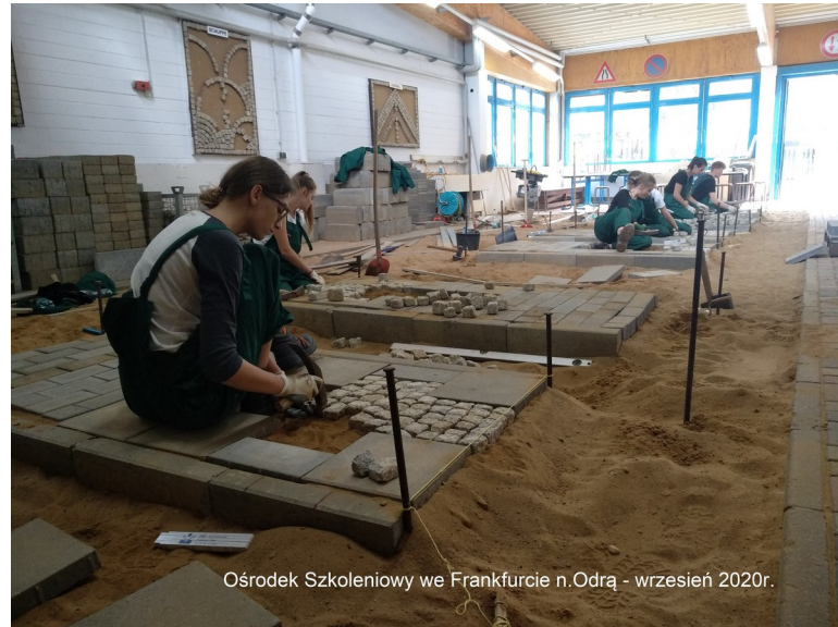
Ośrodek Szkoleniowy we Frankfurcie n.Odra - wrzesień 2020r.