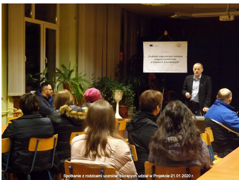
Spotkanie z rodzicami uczniów biorących udział w Projekcie 21.01.2020 r.

W ZSZ nr 1 w Kielcach odbyło się spotkanie organizacyjne z rodzicami i opiekunami uczniów zakwalifikowanymi na praktyki zawodowe do Frankfurtu nad Odrą i Brandenburga w Niemczech w ramach Projektu „Praktyki zagraniczne ważnym etapem kształcenia w Szkołach Zawodowych” finansowanego z Funduszy Unijnych.