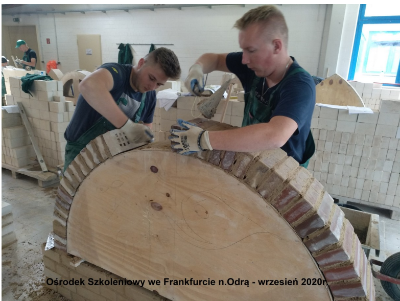
Ośrodek Szkoleniowy we Frankfurcie n.Odra - wrzesień 2020r.