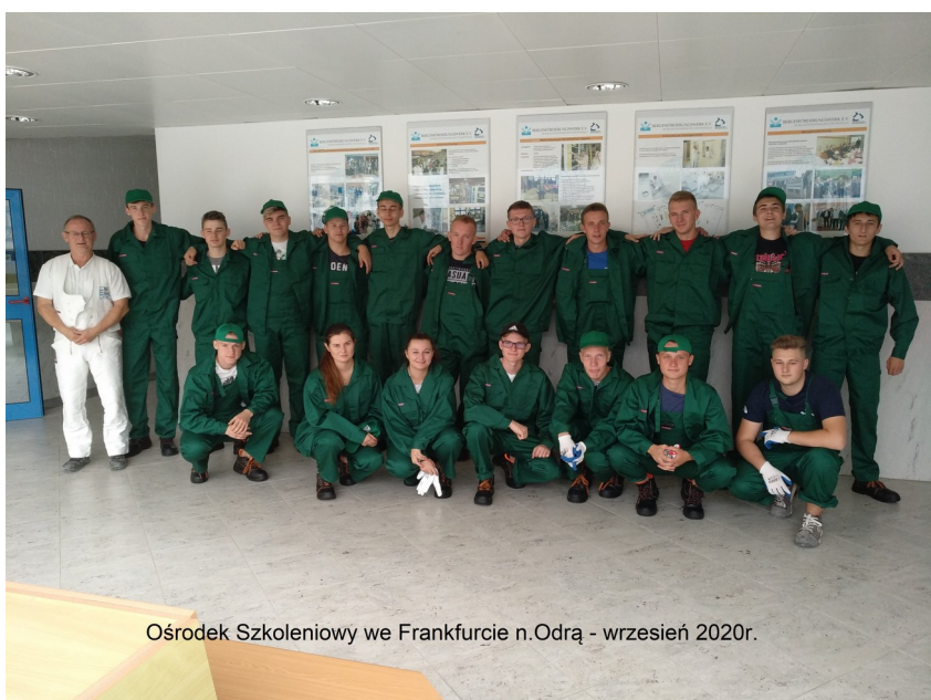
Ośrodek Szkoleniowy we Frankfurcie n.Odra - wrzesień 2020r.