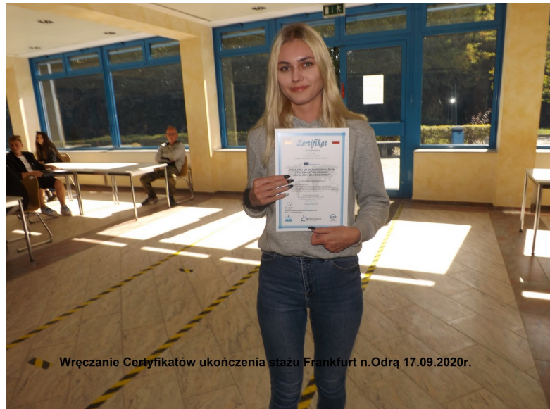
Wręczenie Certyfikatów ukończenia stażu Frankfurt n.Odrą 17.09.2020r.