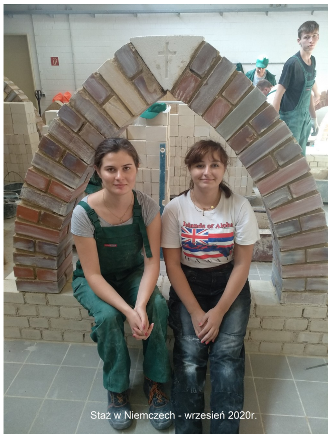
Staż w Niemczech - wrzesień 2020r.