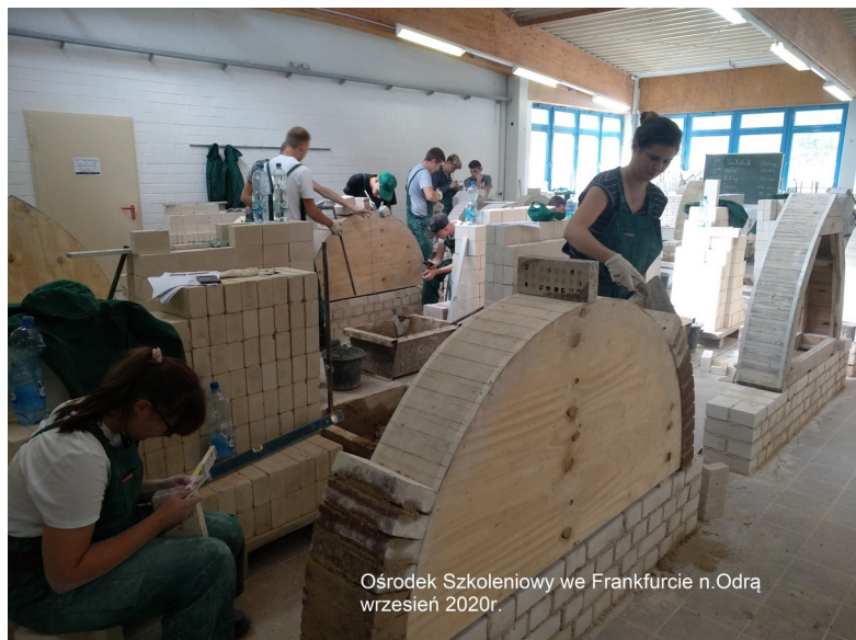
Ośrodek Szkoleniowy we Frankfurcie n.Odra wrzesień 2020r.