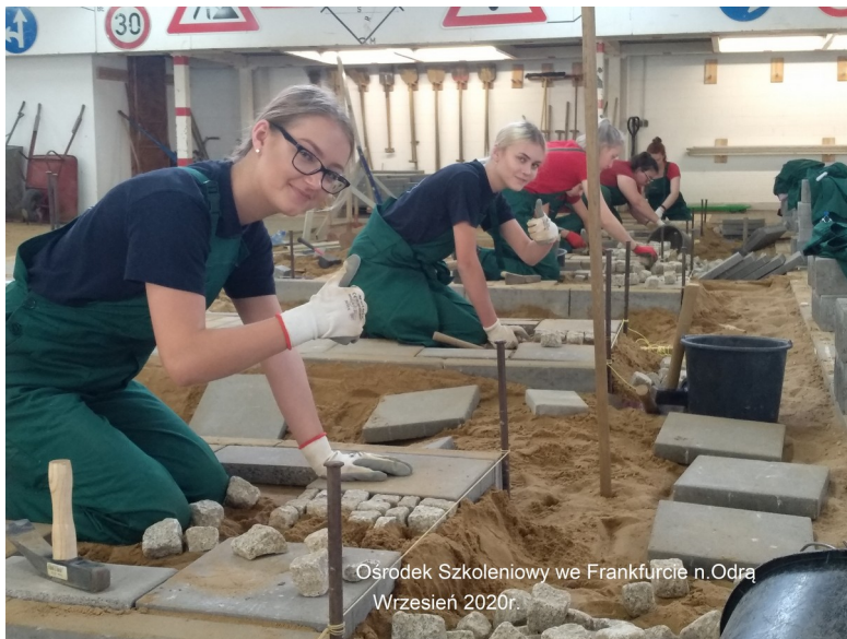
Ośrodek Szkoleniowy we Frankfurcie n.Odra Wrzesień 2020r.

W tym samym okresie uczniowie kierunku Technik budowy dróg i Technik Architektury Krajobrazu pod kierunkiem niemieckich instruktorów układali kostkę brukową i betonową tworząc różnobarwne dekoracje chodnikowe.