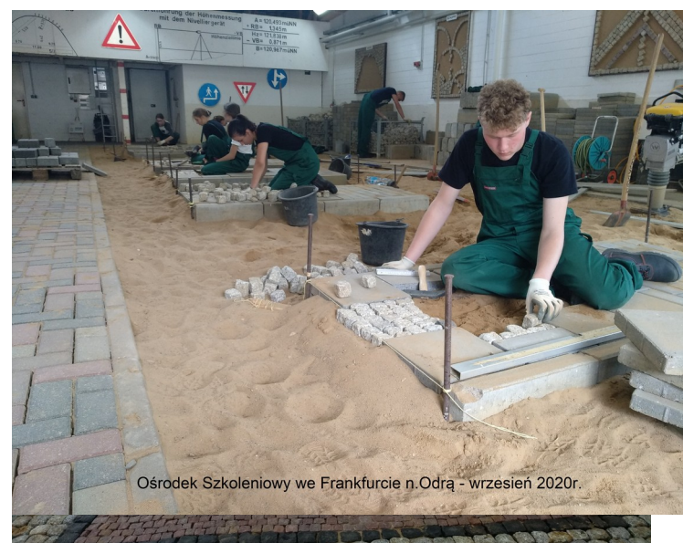
Ośrodek Szkoleniowy we Frankfurcie n.Odra - wrzesień 2020r.