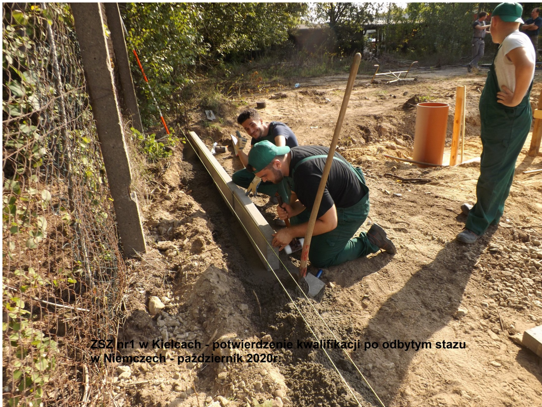
ZSZ nr1 w Kielcach - potwierdzenie kwalifikacji po odbytych stazu w Niemczech - październik 2020r