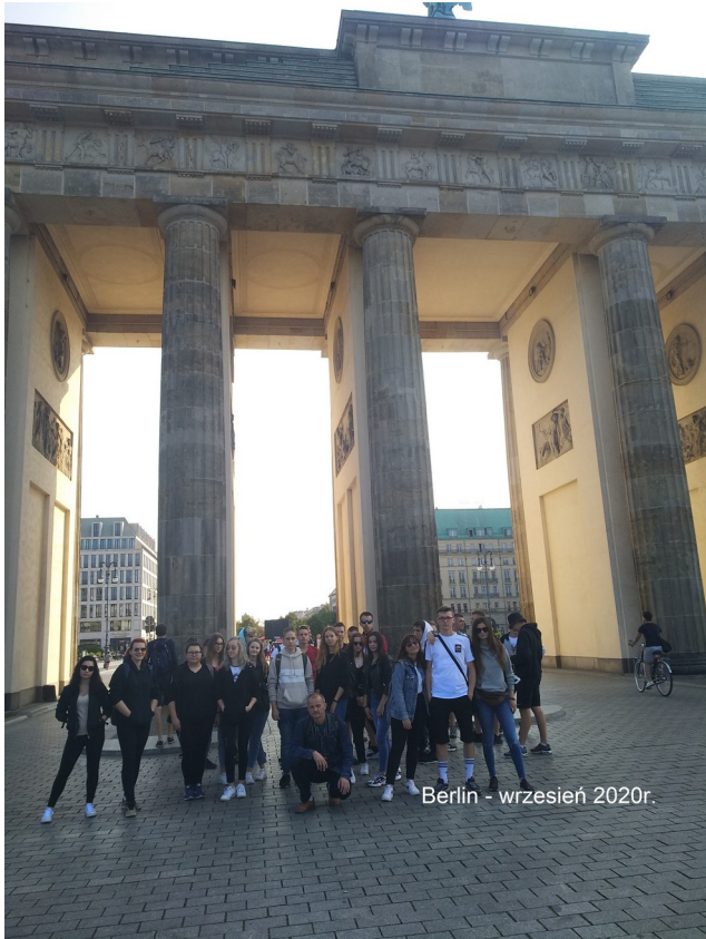
Berlin - wrzesień 2020r.