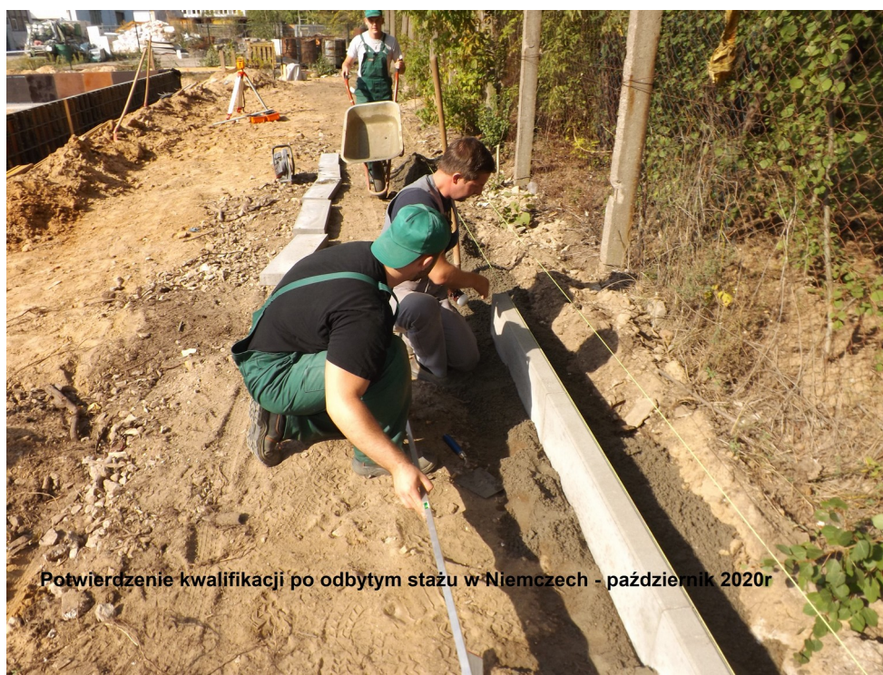
Potwierdzenie kwalifikacji po odbytym stażu w Niemczech - październik 2020r

Po powrocie do Polski odbyło się potwierdzenie kwalifikacji nabytych przez uczniów na stażu w Niemczech. Potwierdzenie kwalifikacji odbyło się na terenie Warsztatu Szkolnego ZSZ nr1 w Kielcach.