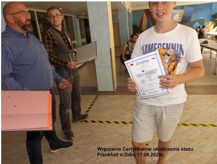
Wręczenie Certyfikatów ukończenia stażu Frankfurt n.Odrą 17.09.2020r.