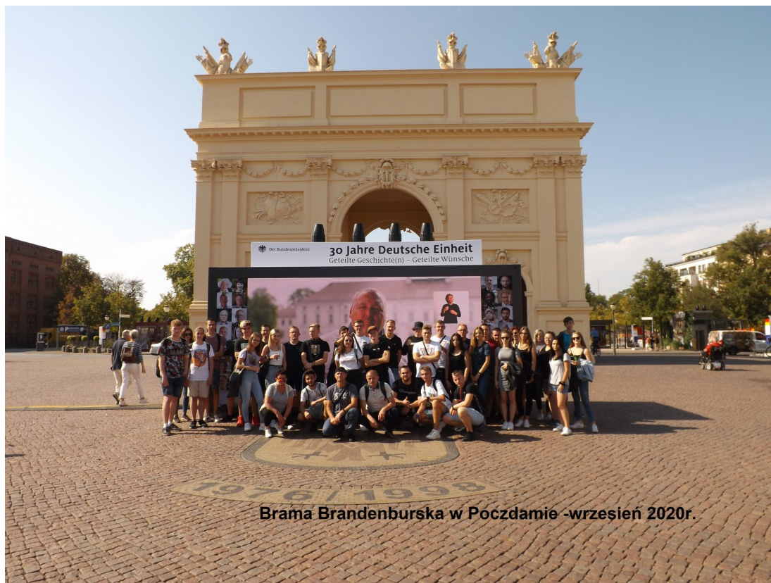
Brama Brandenburska w Poczdamie