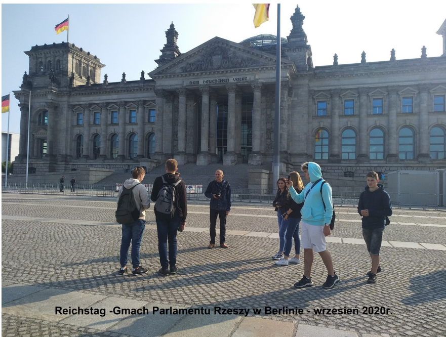
Reichstag -Gmach Parlamentu Rzeszy w Berlinie - wrzesień 2020r.