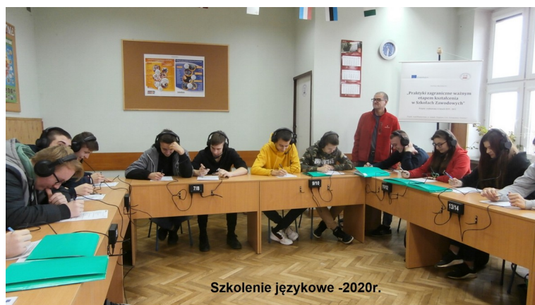
Szkolenie językowe -2020r.